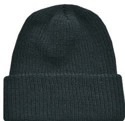
WATCH CAP TUQUE SHAKER