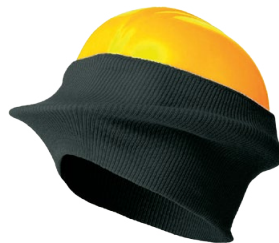
HARD HAT LINER DOUBLURE DE CASQUE