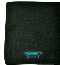
NECK WARMER CACHE-COU