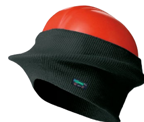
HARD HAT LINER DOUBLURE DE CASSQUE