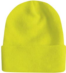
HI-VISIBILITY CUFF TOQUE TUQUE HAUTE-VISIBILITE