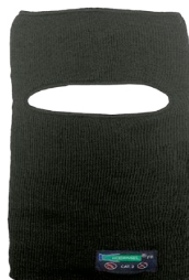
FACE MASK HARD HAT LINER MASQUE FACIAL DOUBLURE DE CASQUE