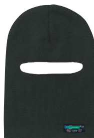
ONE HOLE BALACLAVA CAGOULE À UN TROU