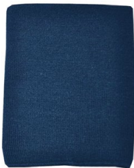
NECK WARMER CACHE-COU