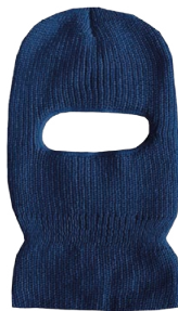
ONE HOLE BALACLAVA CAGOULE À UN TROU