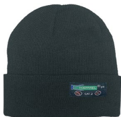
CUFF TOQUE TUQUE À REBORD