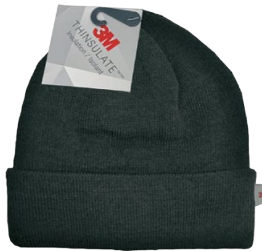
THINSULATE CUFF TOQUE TUQUE THINSULATE