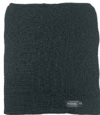
NECK WARMER CACHE-COU