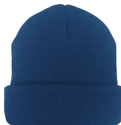
4 LAYER TOQUE TUQUE À 4 ÉPAISSEUR