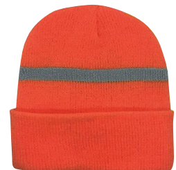
REFLECTIVE TOQUE TUQUE REFLECTIVE