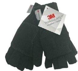
THINSULATE CONVERTABLE MITTENS MITAINES CONVERTIBLES THINSULATE