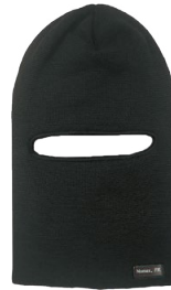
ONE HOLE BALACLAVA CAGOULE À UN TROU