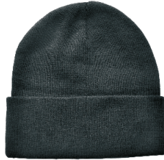
CUFF TOQUE TUQUE À REBORD