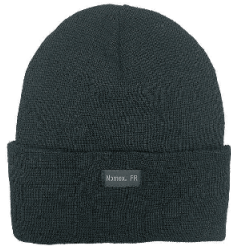
CUFF TOQUE TUQUE À REBORD