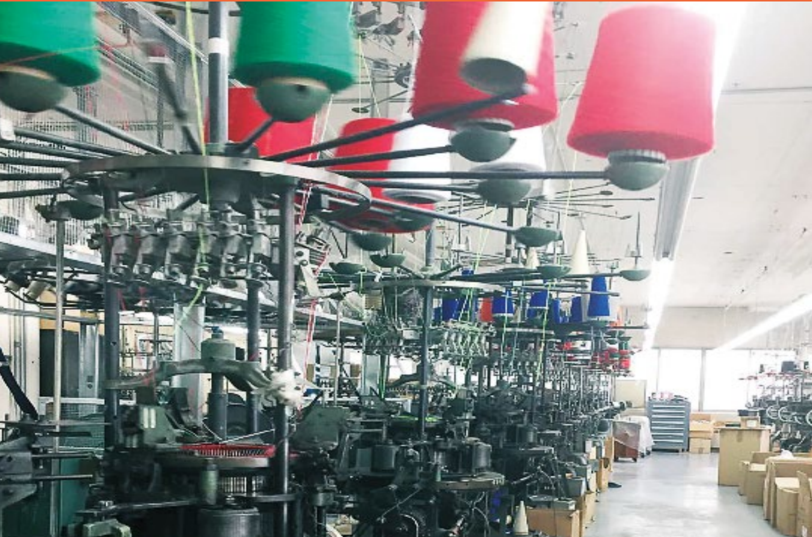
Knitting Department / département de Tricot