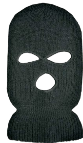
THREE HOLE BALACLAVA CAGOULE À TROIS TROUS